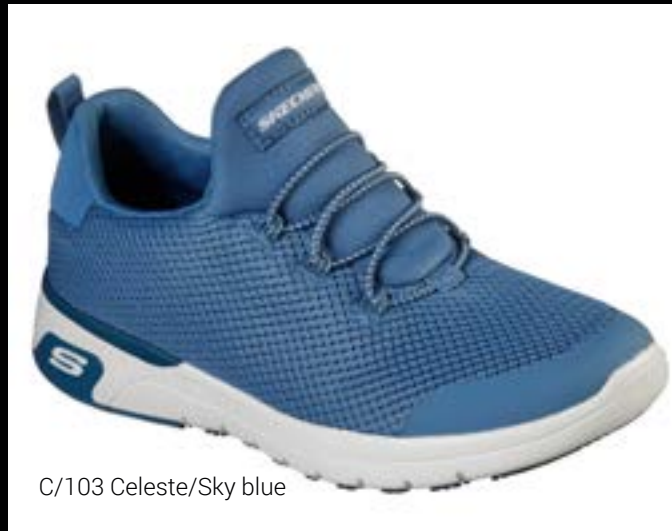
C/103 Celeste/Sky blue