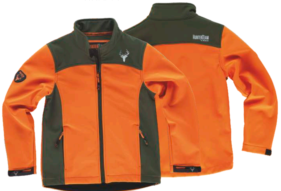
naranja a.v./verde caza

Tejido: 96% Poliéster 4% Elastano (300 g/m2)