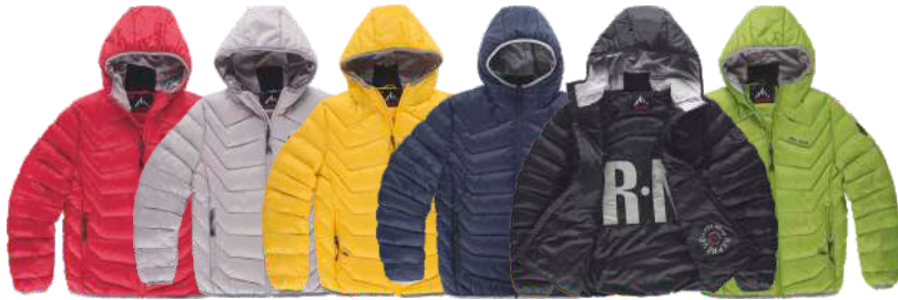
granate perla amarillo oscuro marino negro verde hierba