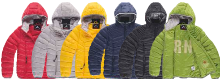
granate perla amarillo oscuro marino negro verde hierba