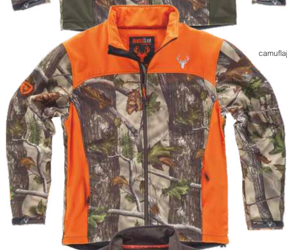
camuflaje bosque verde/naranja a.v.