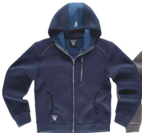
marino / azafata

Tejido Interior: 100% Poliéster (Ext.+Int. 320 g/m2)