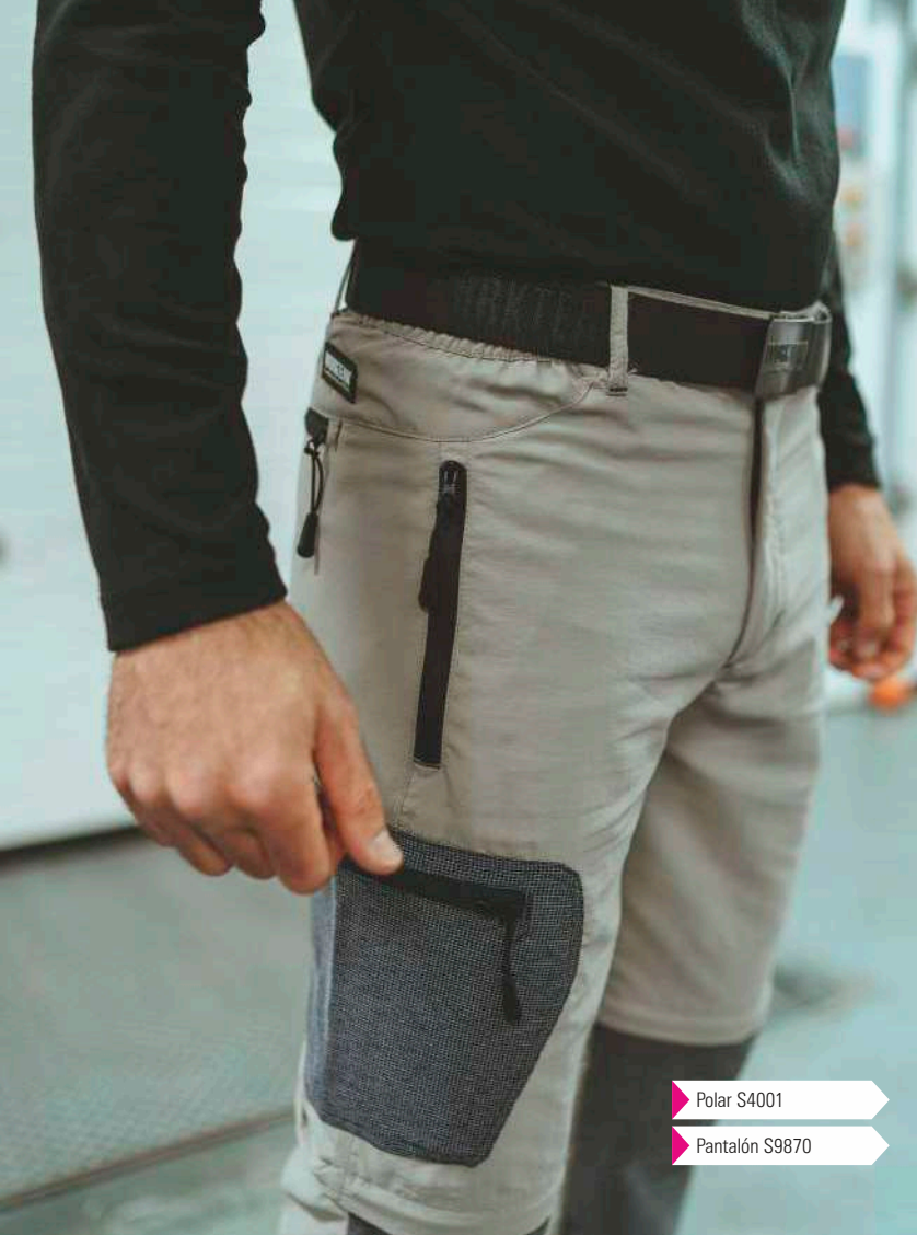
▶ Polar S4001 ▶ Pantalón S9870