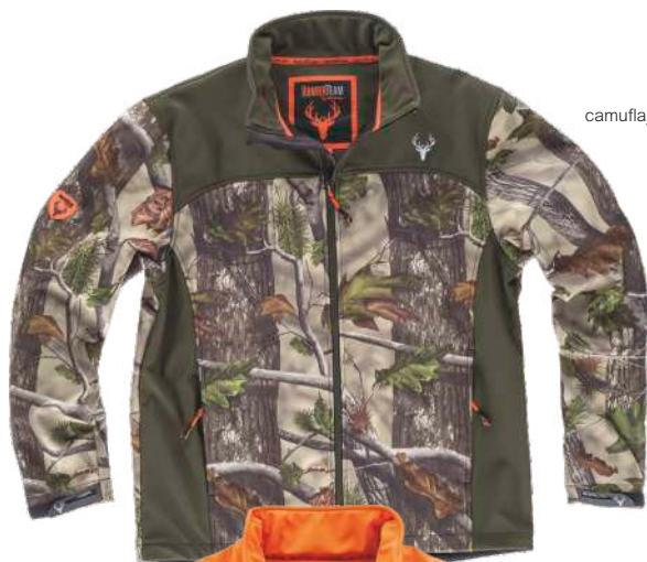
camuflaje bosque verde/verde caza