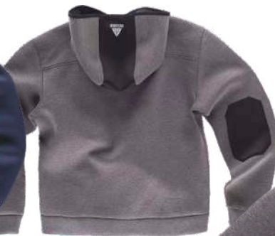
gris / negro