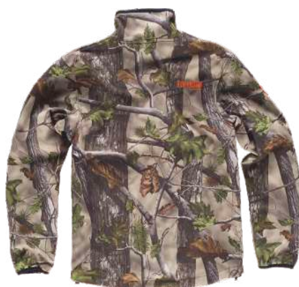
camuflaje bosque verde

Tejido Secundario: 96% Poliéster 4% Elastano (300 g/m 2 )