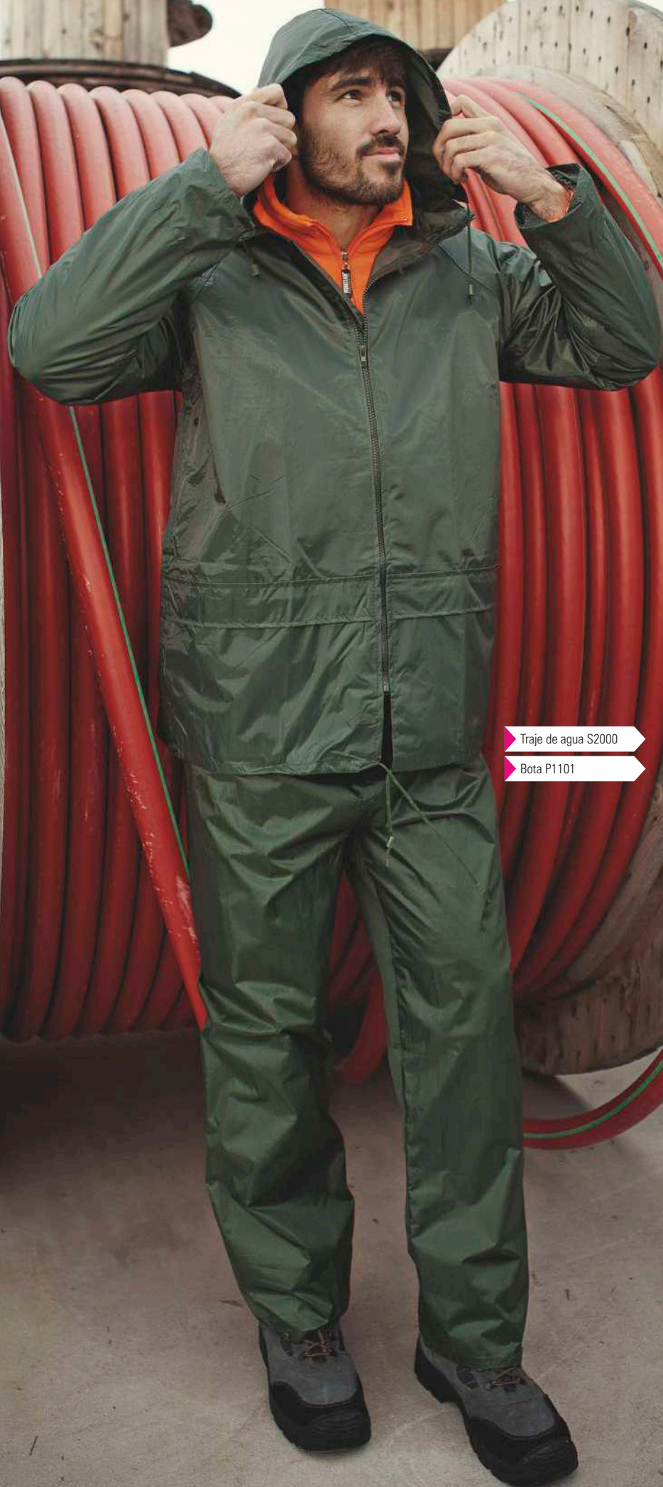
Traje de agua S2000