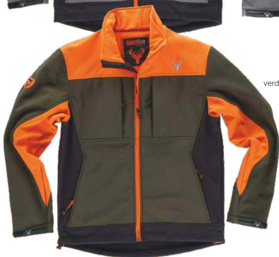
verde caza/negro/naranja a.v.