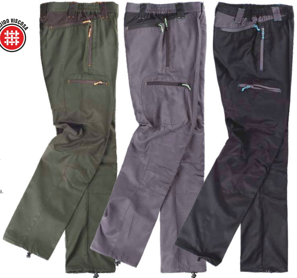
verde caza/marrón gris/negro negro/gris

Tejido: 65% Poliéster 35% Viscosa (240 g/m2)