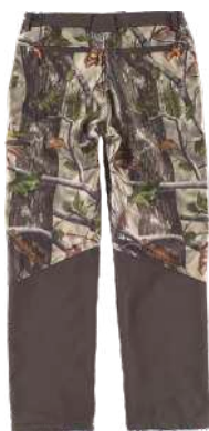
camuflaje bosque verde/marrón