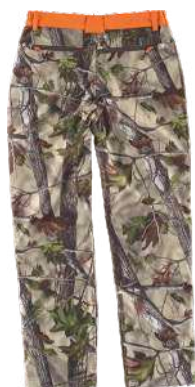
camuflaje bosque verde/haranja a.v.