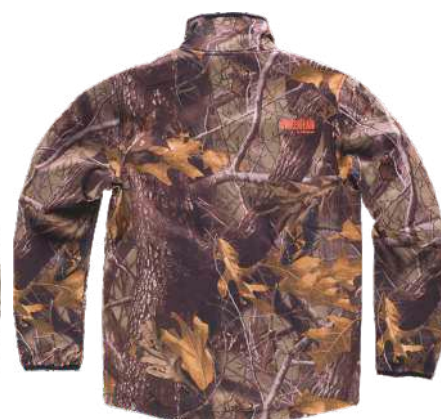
camuflaje bosque marrón