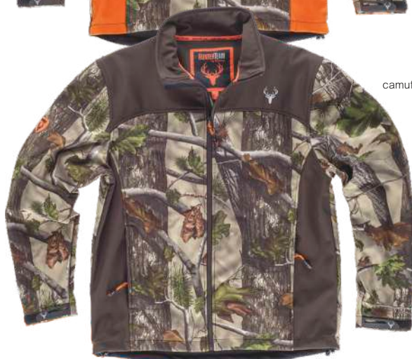
camuflaje bosque verde/marrón