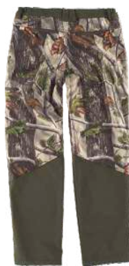
camuflaje bosque verde/verde caza