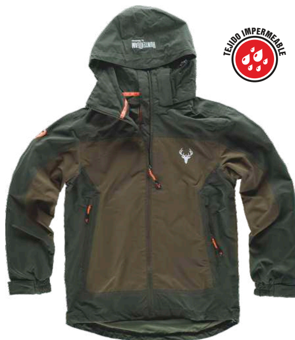
verde bosque/verde oliva

Tejido Interior: 100% Poliéster (65 g/m2)