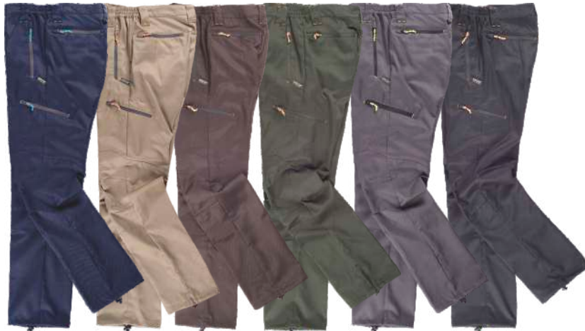
marino beige marrón verde caza gris negro