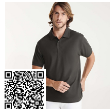
PEGASO PREMIUM PO6609